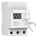
Таблиця 1. Навігація по Функціональному меню

Для керування параметрами використовуйте кнопки «+» та «-». Перше натискання викликає блимання параметра, наступне — зміну.